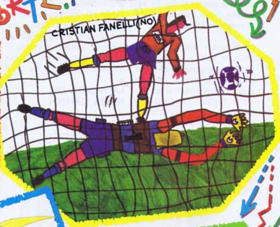
CRISTIAN FANELLI (NO)