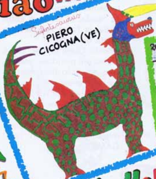
PIERO CICOGNA (VE)